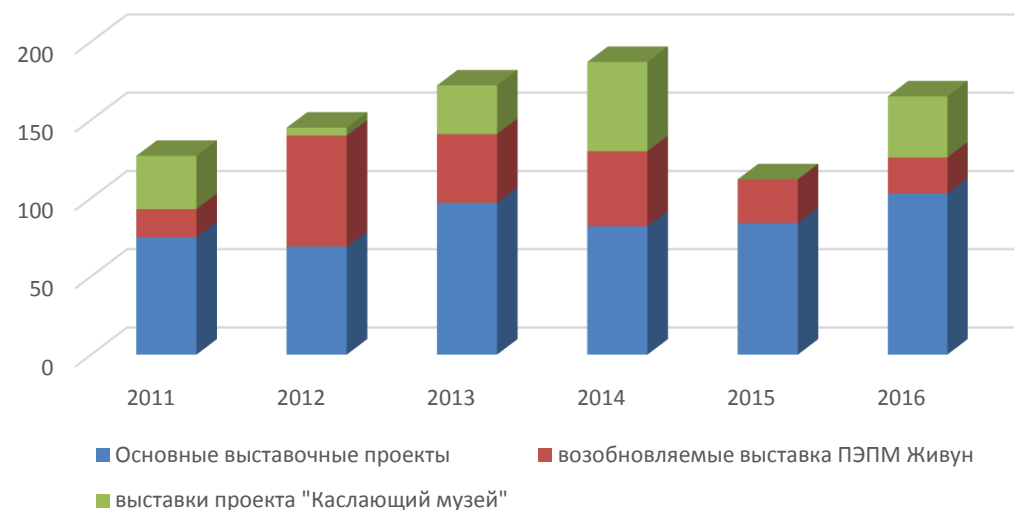
Диаграмма 2. Содержание показателя "Количество выставок всего" за 2011-2016 годы

Следует отметить, что данный показатель вообще сложно планировать, поскольку он во многом зависит от